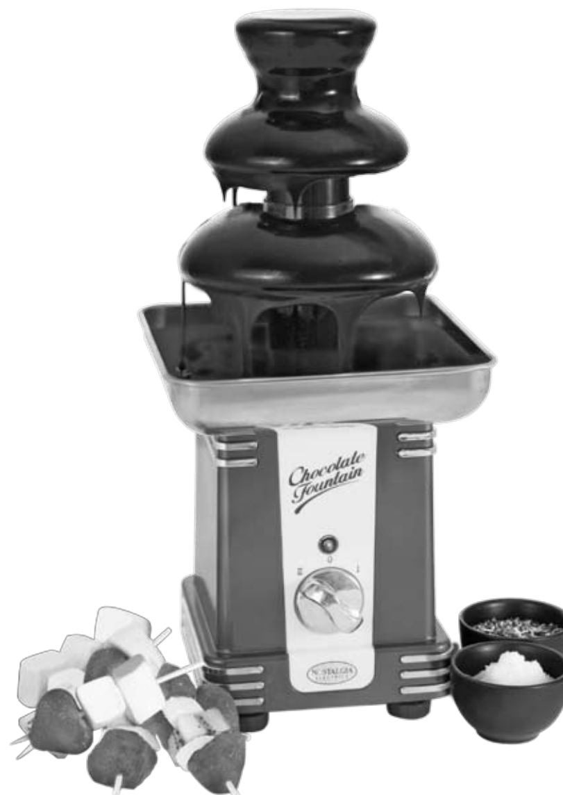
Fontaine à chocolat FC 250