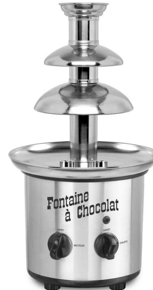
Fontaine à Chocolat FC 260