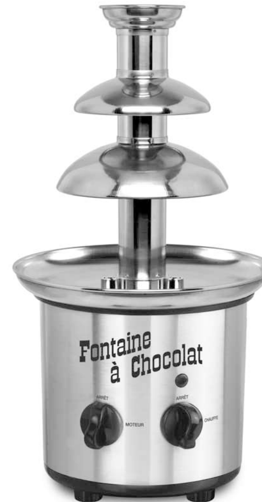
Fontaine à Chocolat FC 260